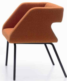
Flai / projekt: Małgorzata Bronikowska produkcja Noti / 6 PE-P