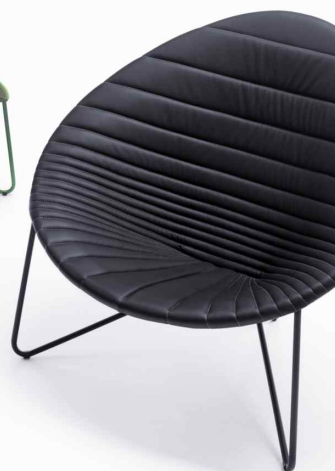
Comfee / projekt: Anna Hrecka produkcja Noti / 6 PE-P

Rola projektanta w procesie rozwoju nowego produktu